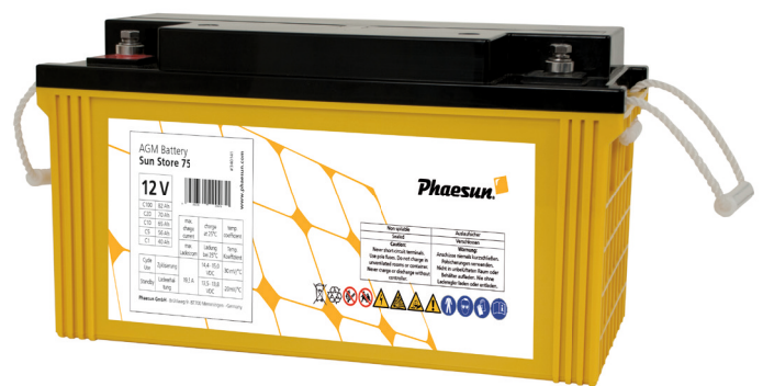
Sun Store 75

Die Phaesun Sun Store AGM Batterien sind sehr robust, wasserdicht, zyklusfest und haben eine lange Lebensdauer. Sie sind sehr effizient und am besten als Allround-Batterien geeignet.